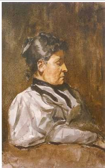
Pablo Picasso 1881-1973 Portrait de la mère de l'artiste Barcelone, juin 1896 Aquarelle sur papier, 19,5x12cm Musée Picasso, Barcelone