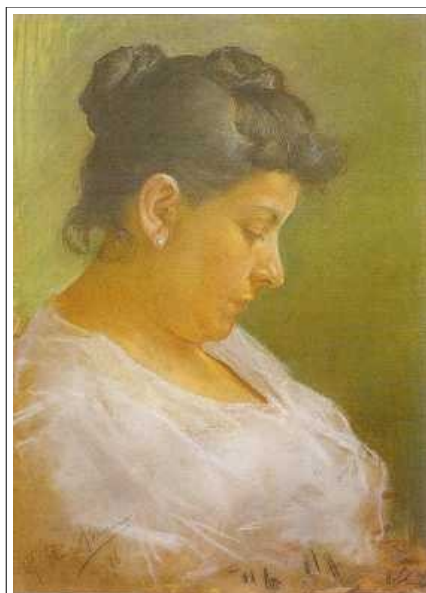
Pablo Picasso 1881-1973 Portrait de la mère de l'artiste Barcelone, 1896 Pastel sur papier, 49,8x39cm Musée Picasso, Barcelone